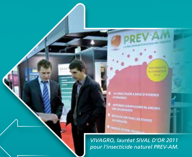
VIVAGRO, lauréat SIVAL D'OR 2011 pour l'insecticide naturel PREV-AM.