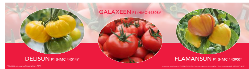
DELISUN F1 (HMC 44514)*

Communication Division (FR2024/12) (12/23) - Photographies non contractuelles - Tous droits réservés © 2023 HM CLAUSE