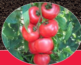
HONEY MOON F1

Nos solutions anti-mildiou en horticulture